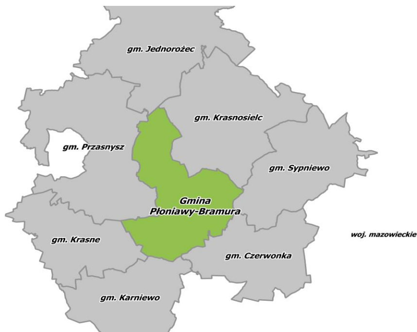
Rysunek 1. Położenie gminy Płoniawy - Bramura na tle sąsiednich gmin.