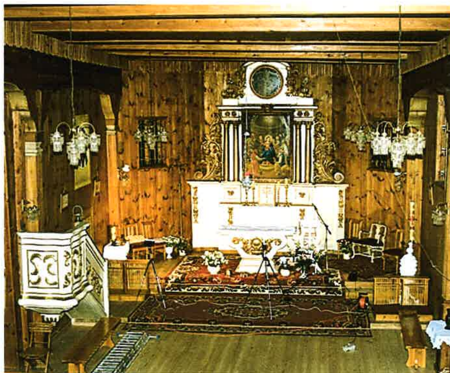
Ołtarz po zakończeniu konserwacji i restauracji.

Najistotniejszym elementem przeprowadzonych prac konserwatorskich i restauratorskich było przywrócenie pierwotnej kolorystyki zabytkowych części ołtarza. Ciemnobrązowa architektura nastawy stanowi tło dla czerwonych trzonów kolumn pokrytych brązowym żyłkowaniem