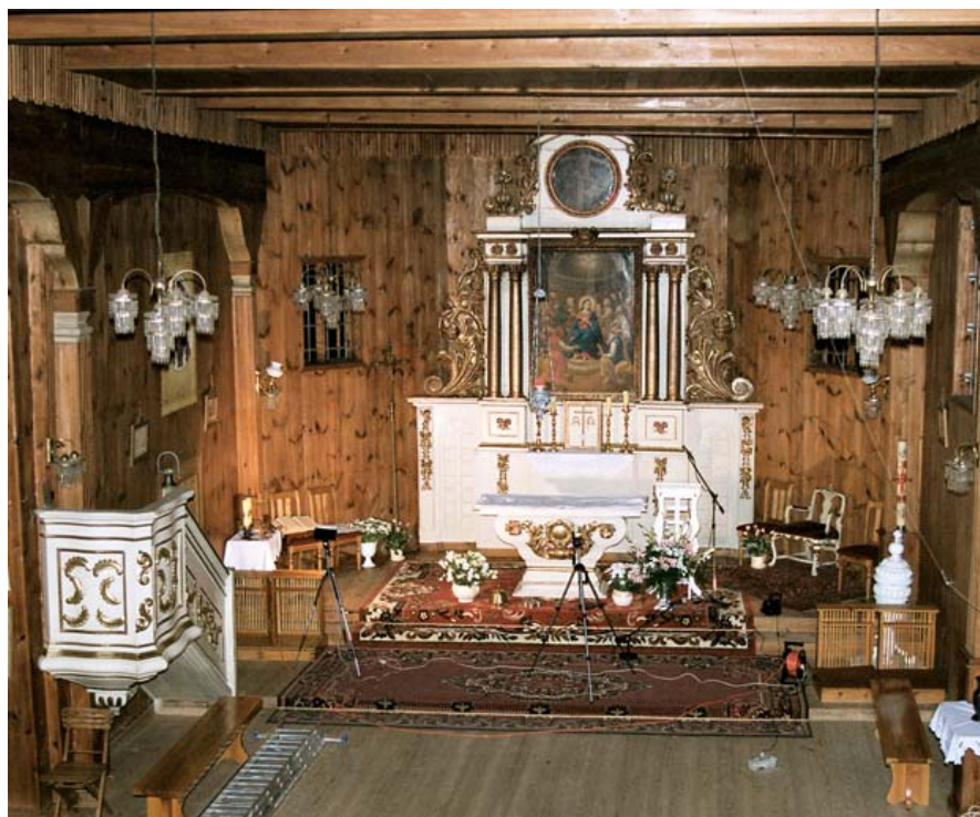
Ołtarz po zakończeniu konserwacji i restauracji.

Najistotniejszym elementem przeprowadzonych prac konserwatorskich i restauratorskich było przywrócenie pierwotnej kolorystyki zabytkowych części ołtarza. Ciemnobrązowa architektura nastawy stanowi tło dla czerwonych trzonów kolumn pokrytych brązowym żyłkowaniem