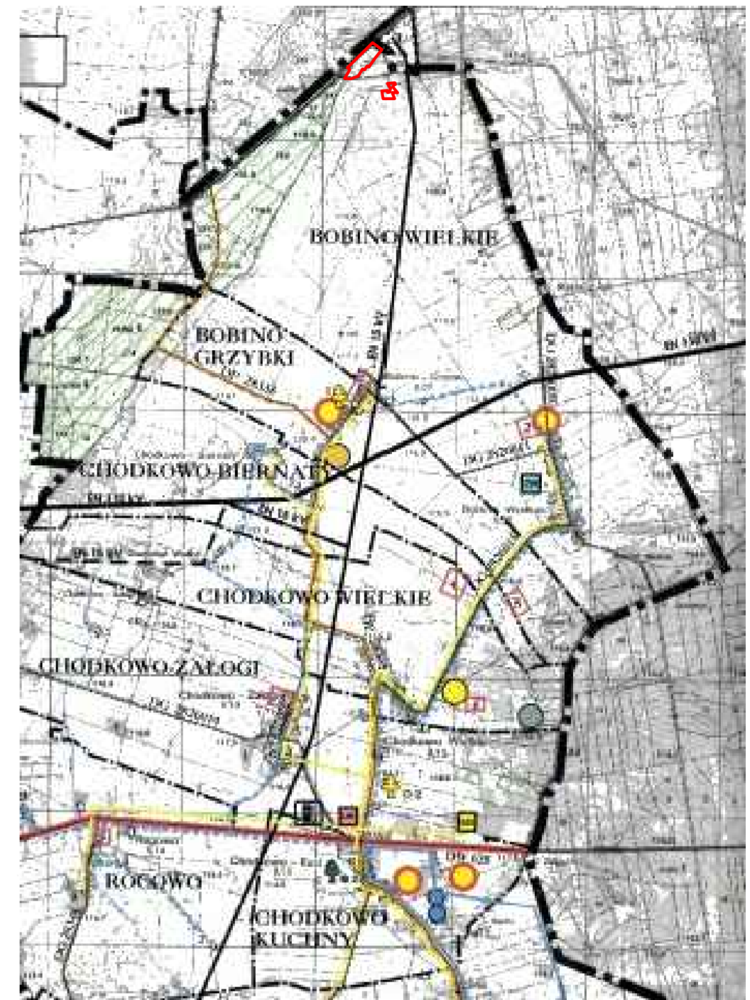
— granica planu zagospodarowania przestrzennego – sołectwo Bobino Wielkie WYRYS ZE STUDIUM UWARUNKOWAŃ I KIERUNKÓW ZAGOSPODAROWANIA PRZESTRZENNEGO GMINY PŁONIAWY - BRAMURA UCHWAŁONEGO UCHWAŁĄ NR 258/XLV/02 RADY GMINY PŁONIAWY - BRAMURA Z DNIA 02 PAŹDZIERNIKA 2002R.